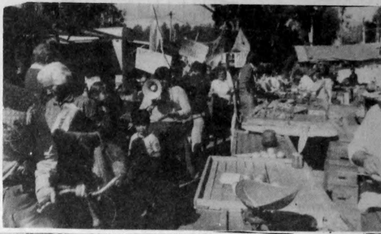
Manifestación contra la carestía en la feria.

M. — Lo que la mujer vive dentro de la casa, el hombre no lo está viviendo. El hombre en la actualidad a lo que se dedica